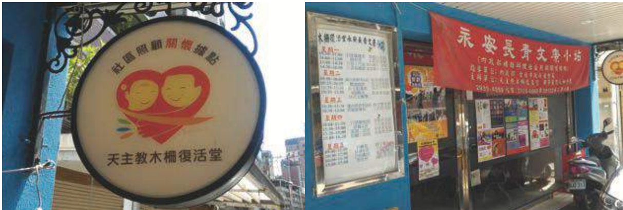
顯眼的招牌、充滿活力和色彩的門口佈置，散發著「家」的愉悅氣息。

若不是門口掛著大大的「社區照顧關懷據點」招牌，第一次接觸位於文山區的木柵復活堂，也許很難聯想到這是一個老人照護的機構據點，或許用「家」來形容可能更貼切一些。這個家有個很特別的名字，叫做「永安長青文康小站」，就是在這裡能夠永保安康，而且大家都像松柏一樣長青的意思！這樣有趣的創意不只在據點的命名上能夠