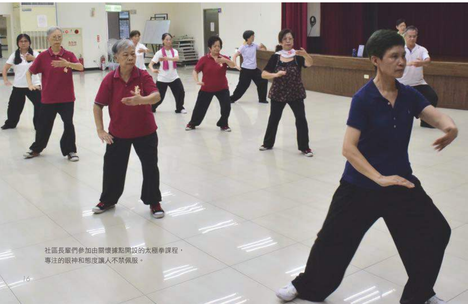
社區長輩們參加由關懷據點開設的太極拳課程，專注的眼神和態度讓人不禁佩服。

朱厝崙社區照顧關懷據點目前有陪伴長者及社區服務志工約60多位，平日輪流陪伴長者進行活動課程，在逢年過節的重大節慶時也會到長者家中進行訪視活動，志工夥伴們多來自朱厝崙社區，雖說志工的年齡約莫在65-歲左右，但從青年志工到銀髮志工都有，志工們在受過基礎訓練與特殊訓練後，