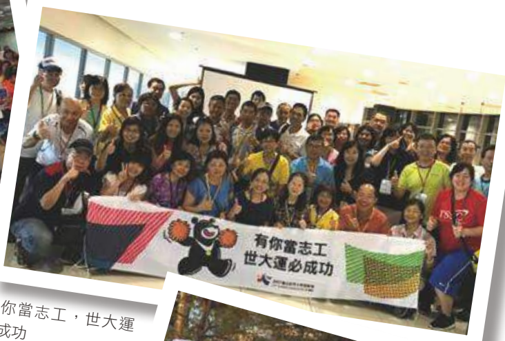
有你當志工，世大運必成功