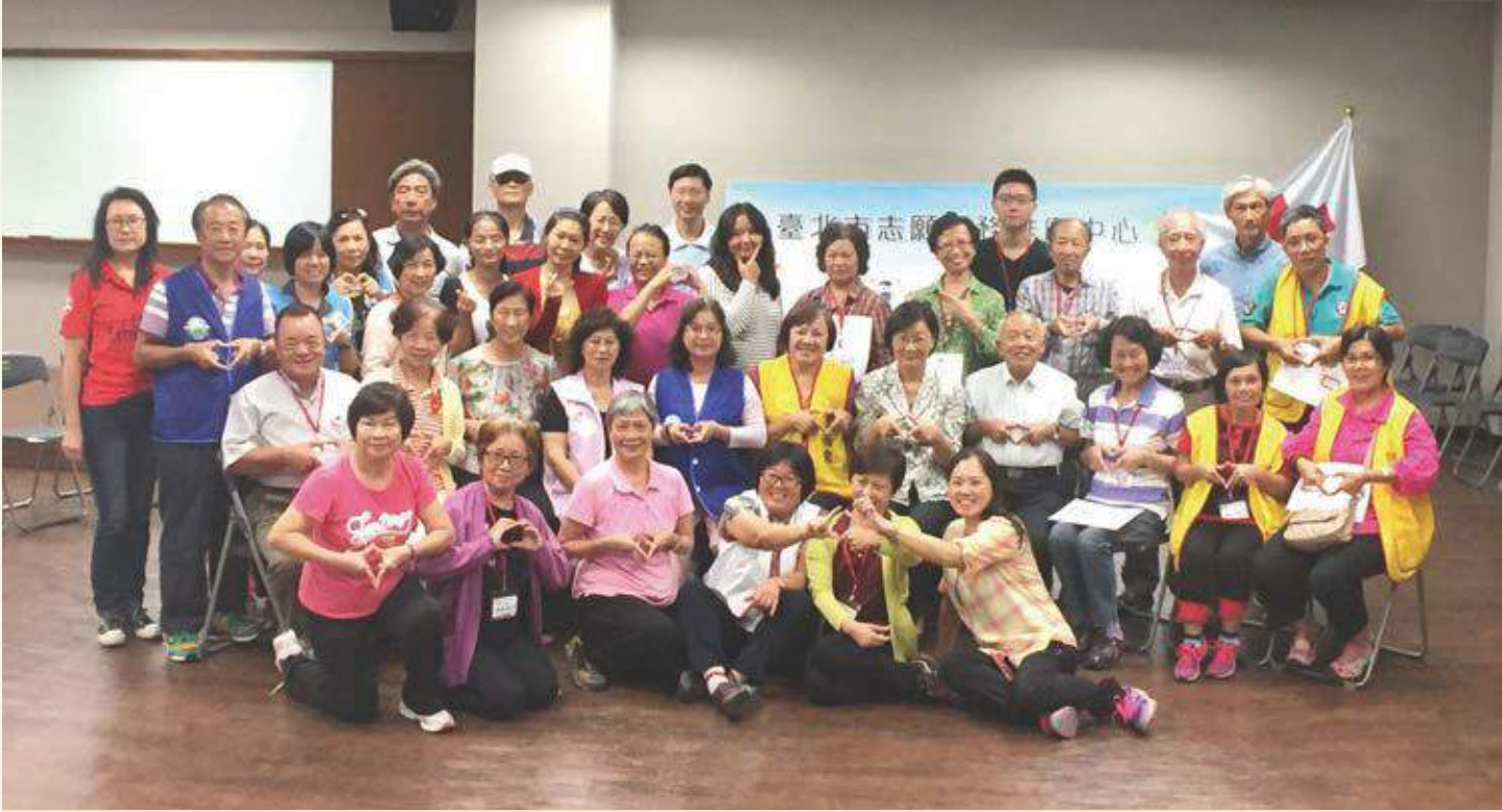
105年度成長訓練成員團體照