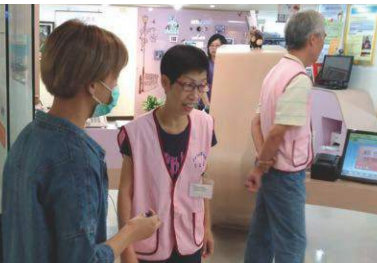
戶政志工是提供民眾戶政服務的第一線

陳主任表示感謝臺北優良志工金鑽獎的鼓勵，內湖戶政志工隊會持續的努力與成長，未來不只會持續發展小志工的培育，也計畫結合華山基金會讓戶政志工隊走入社區，也能夠為社區服務成為大家的志工。👉