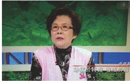
慈濟大愛電視專訪「低碳醫院」環保節能，志工扮演之角色

夜裡的急診室，掛號櫃台前，站著一名急湊著醫藥費的外籍中年男子，正掏著口袋裡的零錢，就差200塊錢；而休息區，則坐著9個不滿3歲的幼兒，外加三名20歲左右的年輕母親及一名年輕男子，吃喝著手上的食物，卻任由小孩在地上嬉戲喧鬧，只因等待另一名嬰兒因發燒昏厥，正由醫生搶救中；在檢傷區裡躺著剛一位無依的老人，意識不清的呻吟著；此時救護車又送來，一名被機車撞倒的中年婦人，大聲哀嚎痛楚難