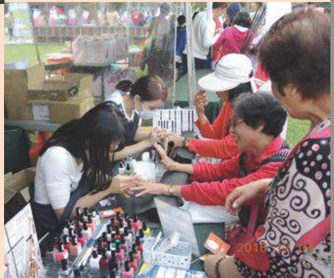
幸福商家ANNY NAIL BAR 於現場提供兌換服務時數的民眾體驗美甲服務