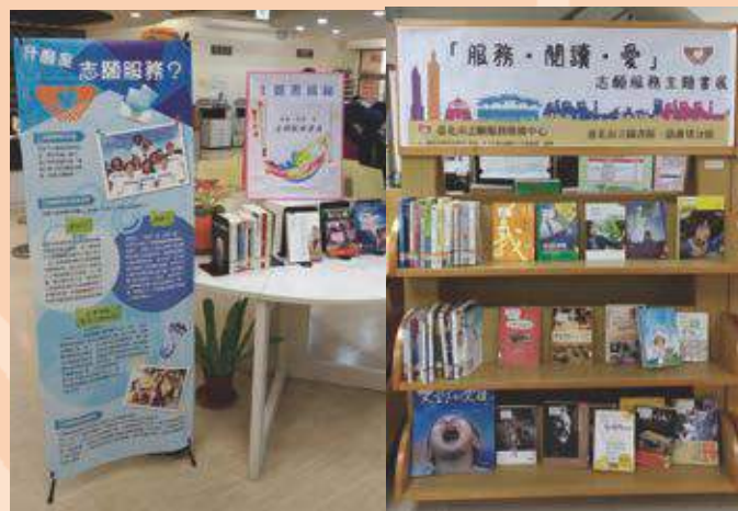
「服務·閱讀·愛」志願服務書展