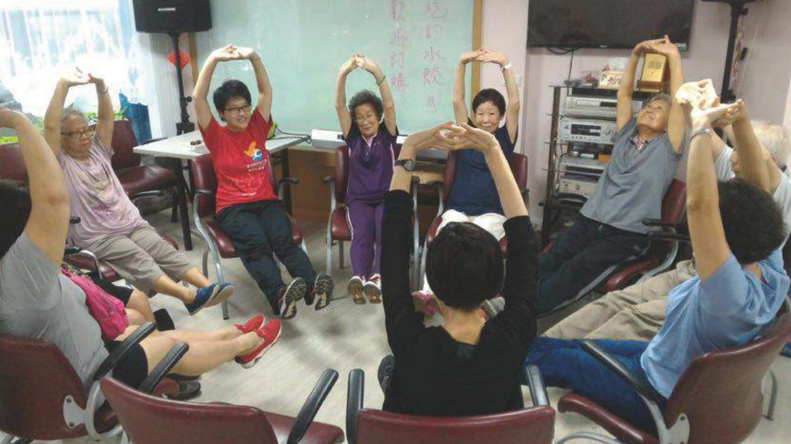
年輕的老師帶著長輩們一起「動手動腳」！