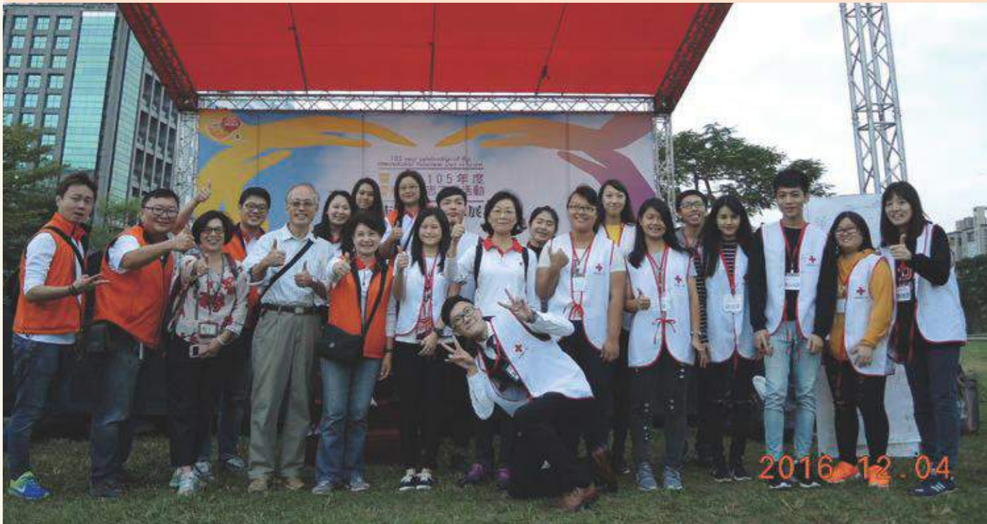
社會局長官與協辦的紅十字總會及華倫提爾青年志工大使