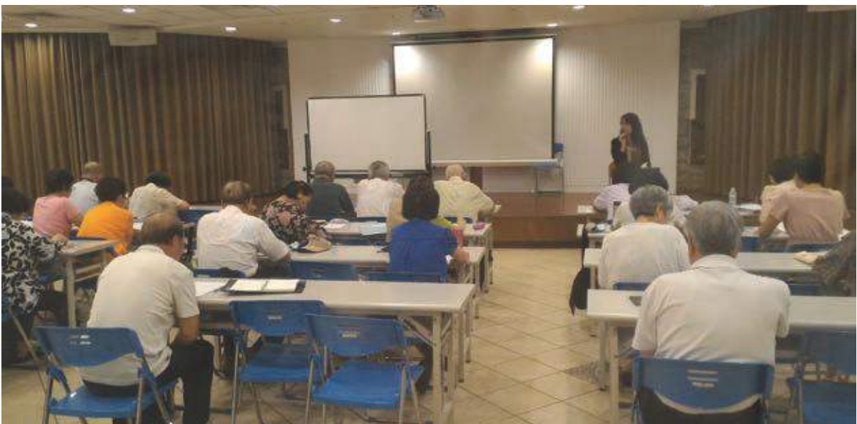
據點內的長輩們正在進行英文歌曲的學習，長輩們精準的發音讓人驚豔。

裡多元的課程內容，例如與社區大學結合的毛線編織課、帶領年長者一同進行的桌上遊戲課、讓長者們盡情發揮的歌唱課程等，其中最令我感興趣的是，帶領據點長輩們一同製作「生命繪本」的課程。