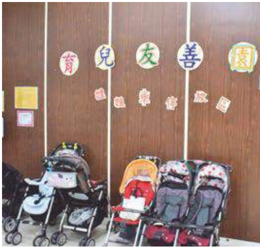
貼心的育兒友善園，讓社區關懷據點不僅有長輩們的歡笑，也充滿小朋友們開心的笑聲。