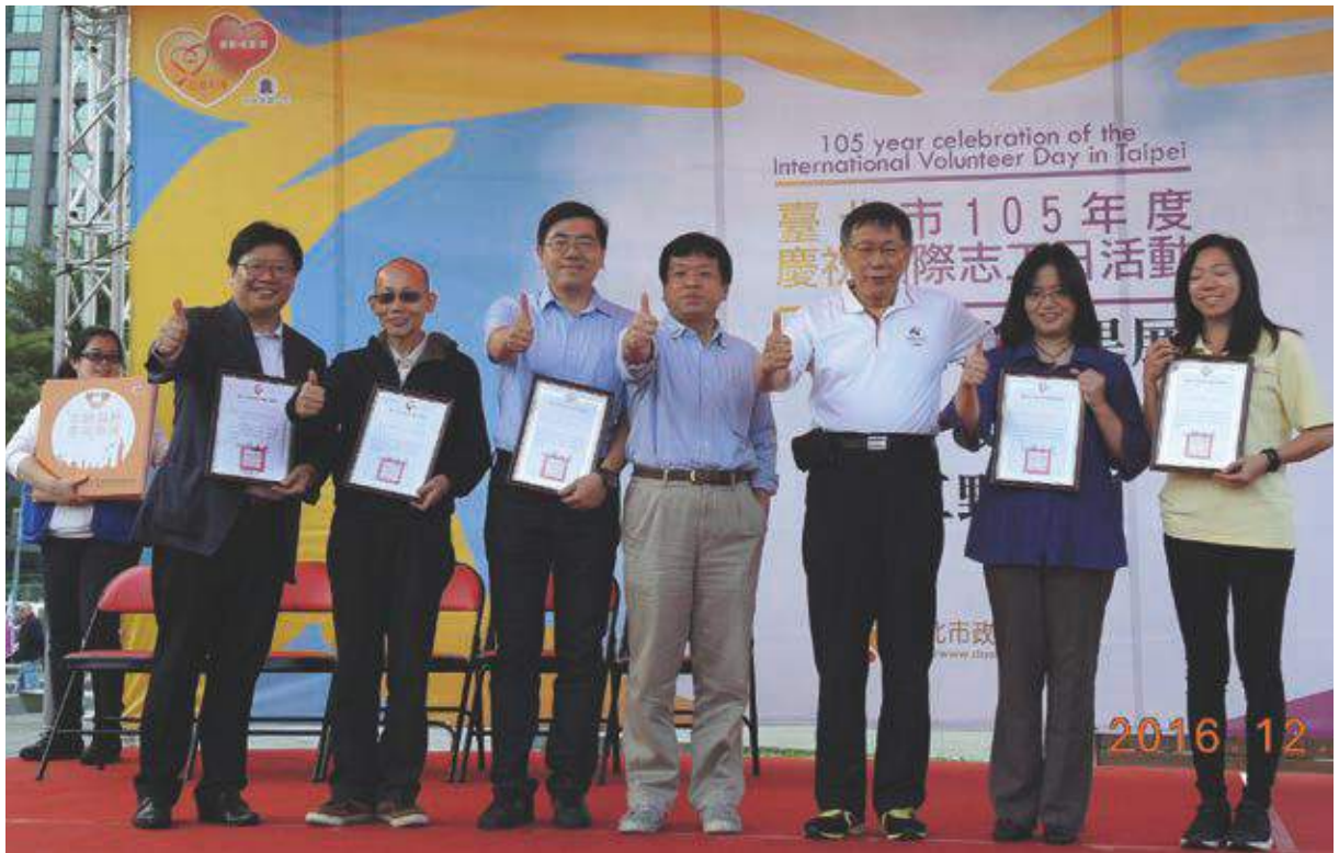
柯市長頒發社會福利與綜合類志願服務單位績優獎

1985年12月聯合國正式宣布每年12月5日為國際志工日(International Volunteer Day)，肯定志工們為社會無私奉獻的偉大，並建議各國政府舉辦慶祝國際志工日活動。