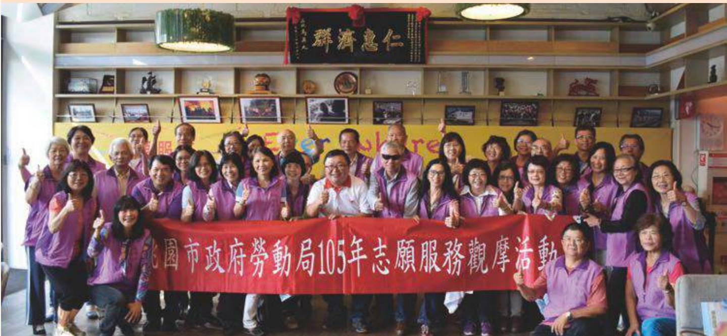
桃園市政府勞動局志工參訪觀摩活動