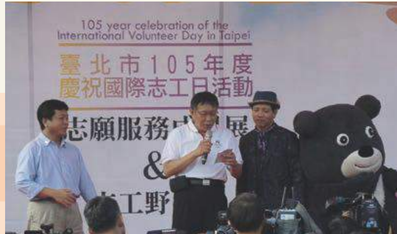
柯文哲市長蒞臨野餐日活動