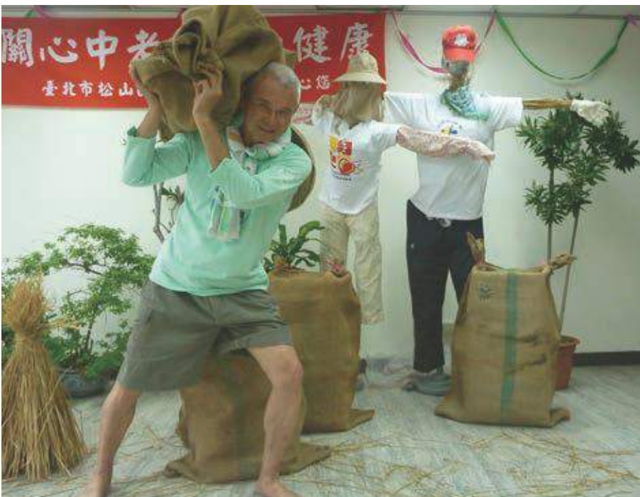
健康活動「來呷台灣米」演出

朋友引薦加入松山健康中心志工，到目前我經常向退休朋友推薦。除了到社區的健康服務量血壓、協助填表格，登革熱防