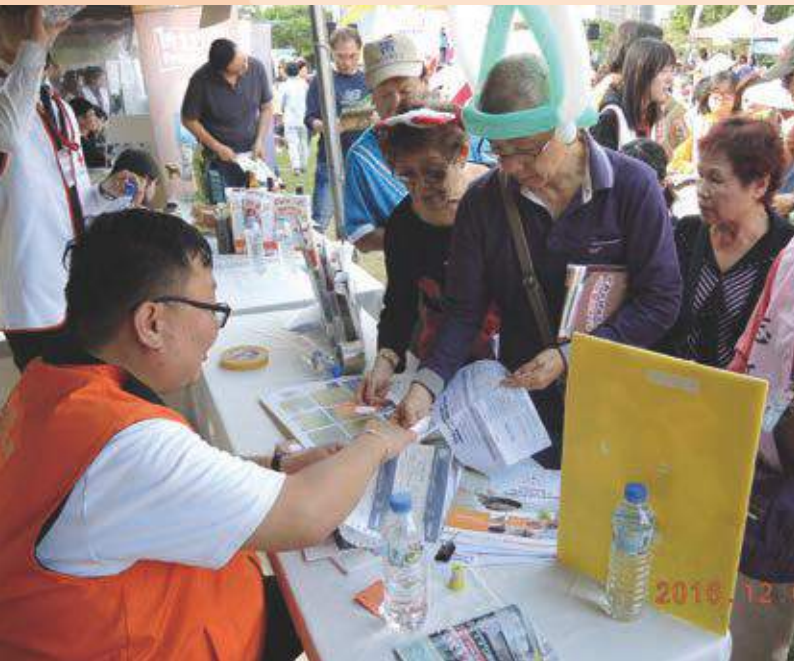
民眾以服務時數兌換想念飛飛演唱會門票