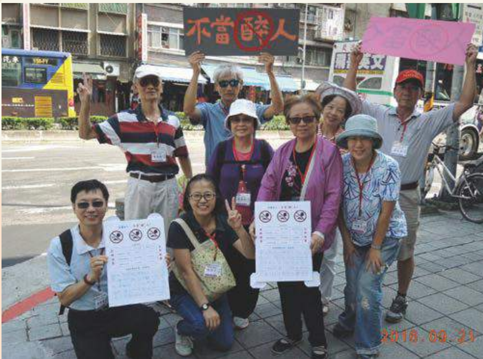
成長訓練服務 學習課程-1