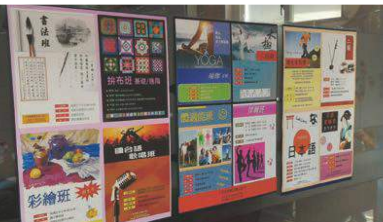
每一張海報就是一堂充滿創意的課程，讓據點裡的長輩們時時都有新鮮事。

湘齡除了介紹據點的各種特色外，也特別感謝「社區照顧關懷據點5.0」計畫的推動，由於有計畫的補助，讓據點能夠不必煩惱據點的專職人力，雖然計畫也只是部分補助，但對社區據點的運作而言，能夠有這樣的資源已經是相當大的幫助，希望未來也能夠持續推動這樣的計畫。 🍊