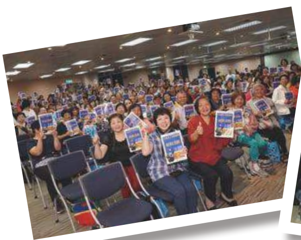
世大運志工特殊訓練