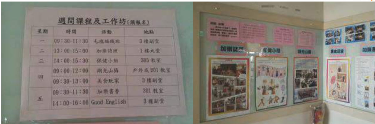
公佈欄上周一到周五每天都有各種不同的趣味課程，提供長輩們多元的選擇。