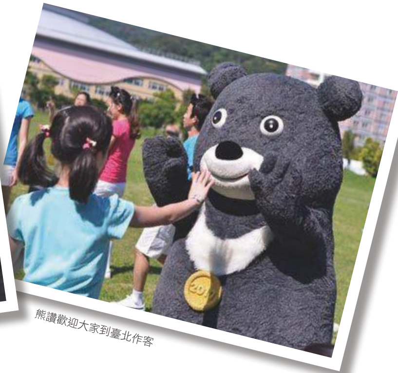
熊讚歡迎大家到臺北作客

別為臺北與巴西。2011年11月29日晚間7時（臺北時間30日凌晨2時），國際大學運動總會（FISU）宣布，臺北市獲得2017年夏季世界大學運動會主辦權。