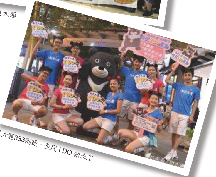
世大運333倒數，全民I DO 做志工

是以協助世大運賽會活動進行為主，而志工招募與運用管理單位的重要任務，就是使志工能夠樂在服務，並且保障志工該有的權益。