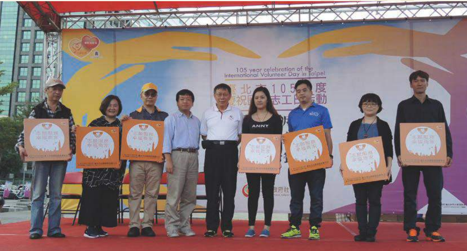
「集時行動」活動開始囉！柯市長頒發幸福商家標章