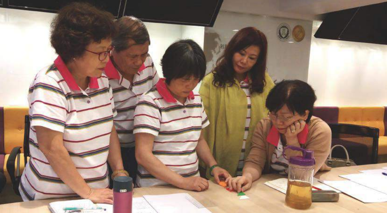
志工幹部訓練營 (左一)

射區，傳來叫罵聲，為何不是被撞傷的婦人應該優先照X光，而是機車騎士優先照呢？櫃台區的中年男子則拜託著是否可先欠款？此時喧鬧聲更大了，氣氛吵雜，讓意識模糊的老人也難以忍受，霎時也大聲喊叫；此時門口走進來一位即將臨盆的女子，下體出血不止，此時停住了所有人的目光，叫罵聲、嬉鬧聲迅速靜了下來。